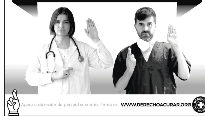
Cartaz promocional da campaña "Dereito a curar".

Outro exemplo máis recente, é a campaña "Dereito a curar" de "Médicos do Mundo en España", que chama ao persoal do sistema sanitario público a seguir atendendo as persoas sen permiso de residencia : facendo así estéril o Real Decreto 16/2012 que deixa sen atención sanitaria a este colectivo dende o 1 de setembro de 2012.