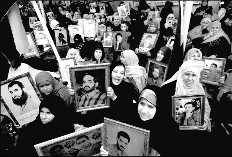
Familiares dos presos palestinos en folga de fame manifestanse contra o réxime de detención administrativa argallado polo estado israelí.

Un tipo de folga extremo é a folga de fame , como a de 28 días sostida na primavera de 2012, por un milleiro de presos palestinos ata que conseguiron que Israel suspendese as detencións ilegais indefinidas.