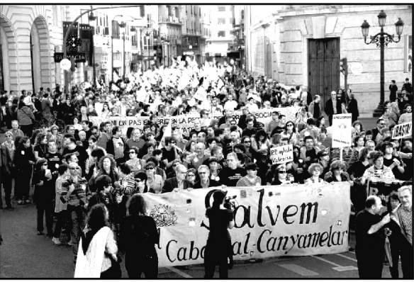
Marcha dos veciños do Cabanyal.

Un exemplo de participación directa é o caso do barrio do Cabanyal de Valencia: onde en 1999 o colectivo "Salvem o Cabanyal" presentou 110.380 alegacións ao plan urbanístico até que conseguiu que o Tribunal Supremo obrigara ao Concello de Valencia detívase a demolición do seu barrio.